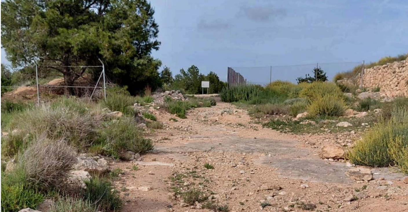
Fotografías del vecino donde se aprecia la nueva valla a la izquierda y el yacimiento a la derecha