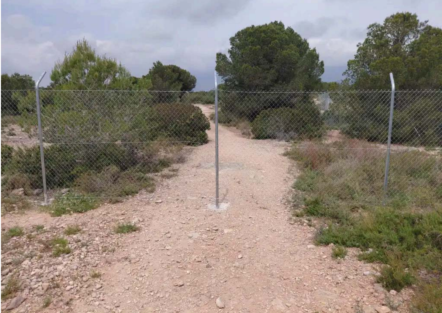
Camino habitual para los senderistas cortado por completo

La preocupación vecinal crece mientras continúan las obras y se espera que los informes técnicos y las actuaciones administrativas determinen si la instalación de la valla vulnera la normativa de protección patrimonial vigente.