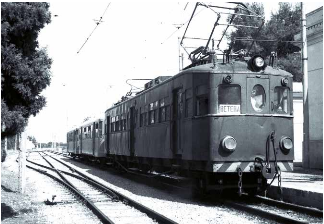
FOTOGRAFIAS DEL TRENET EN MASIAS (AUTOR JUANJO OLAIZOLA)