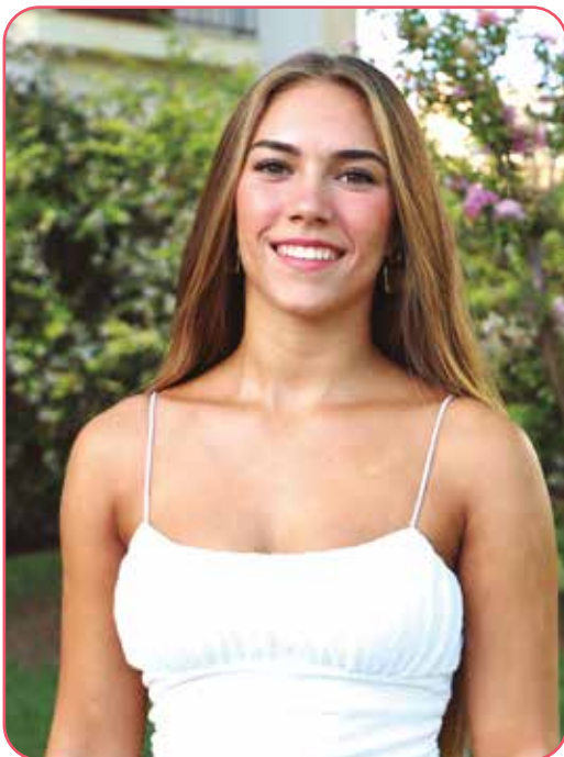
Corte de Honor Fiestas 2023

¿A qué te dedicas y que te gustaría ser en el futuro?