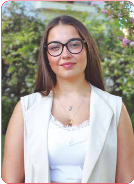
Corte de Honor Fiestas 2023

¿A qué te dedicas y que te gustaría ser en el futuro?