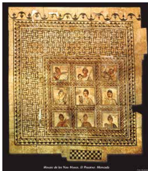
Foto 6, Mosaic de les Nou Muses