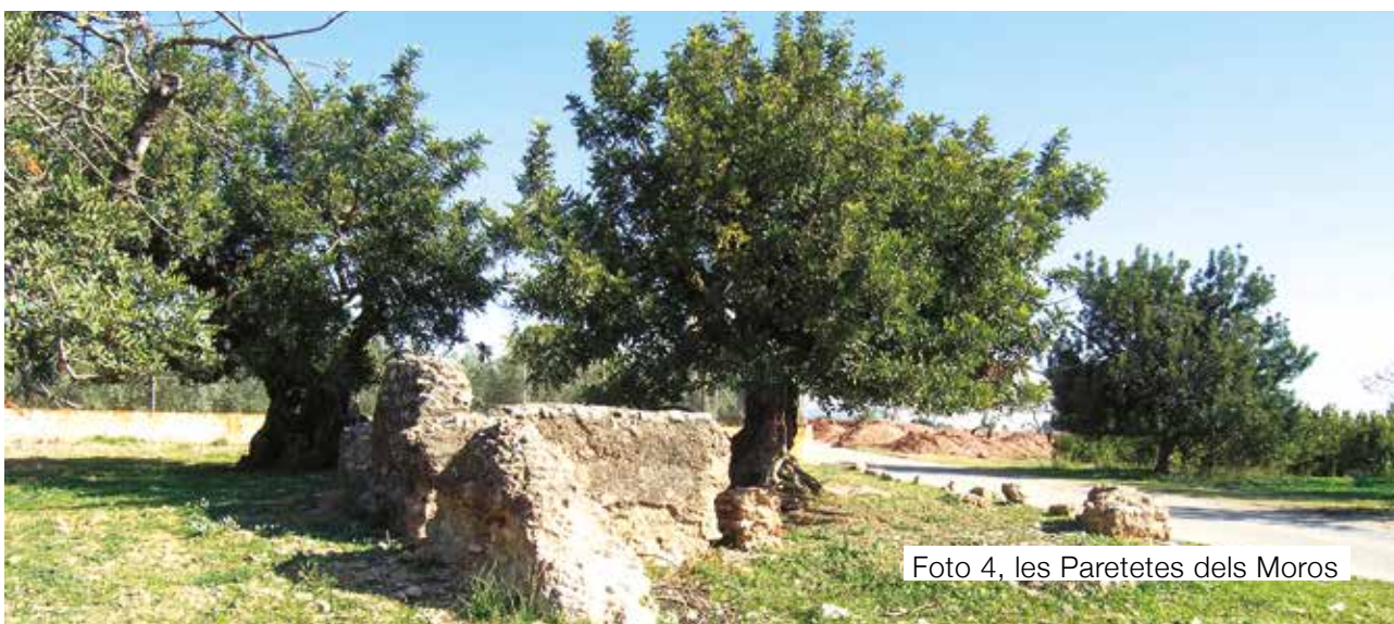
Foto 4, les Paretetes dels Moros

ros, destruïda parcialment per les transformacions agrícoles de la primera meitat del segle XX (jaciment publicat en l'any 2000 a les Actes del 1r Congrés d'Història de l'Horta Nord), les novetats són que l'Ajuntament de Montcada està molt interessat en la seua investigació, excavació i museïtzació, de manera que prompte s'iniciaran les converses amb els seus propietaris per veure de fer públic el jaciment i començar el procés de revaloritzar-lo. Es tracta d'una parcel·la d'aproximadament 5.000 m 2 en què encara es conserven abundants estructures constructives i que va estar ocupat des del s. I aC. al s. IV dC.