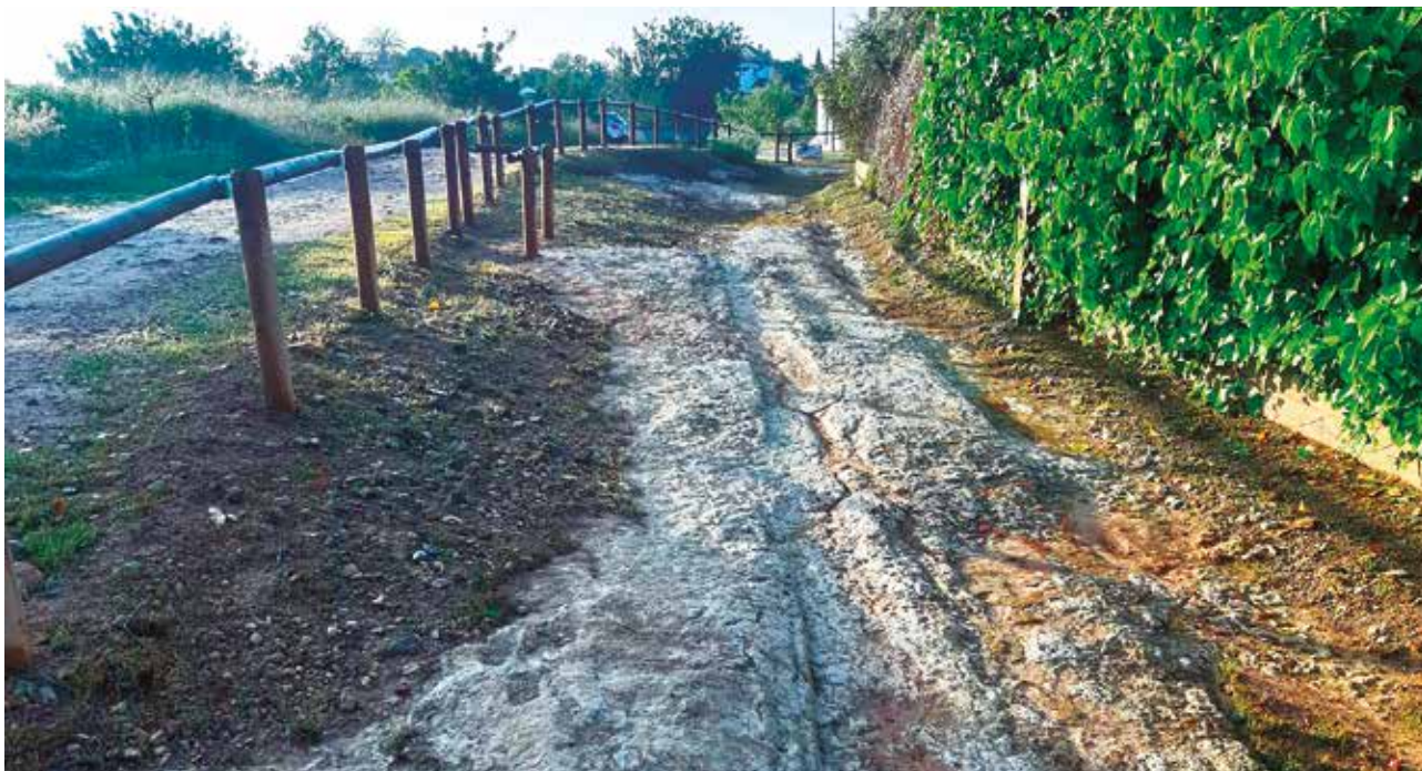
Foto 3 Camí dels Fornets

(2001, 2015), de les intervencions arqueològiques al Tòs Pelat (2006), de les excavacions al Ravalet (2007), del projecte europeu Aristhot (2008), del Museu Arqueològic Municipal (2011), del singular jaciment del camí ibèric dels Fornets (2013), de la Fàbrica de la Seda (2017, 2022), de la Flora del Tòs Pelat (2018), dels Espais Museogràfics Montcadins que trobem a la pàgina web municipal (2019), etc.