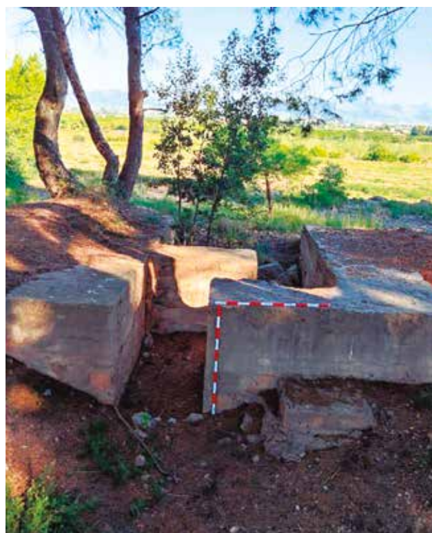
Foto 2 Búnquer Mas Blau