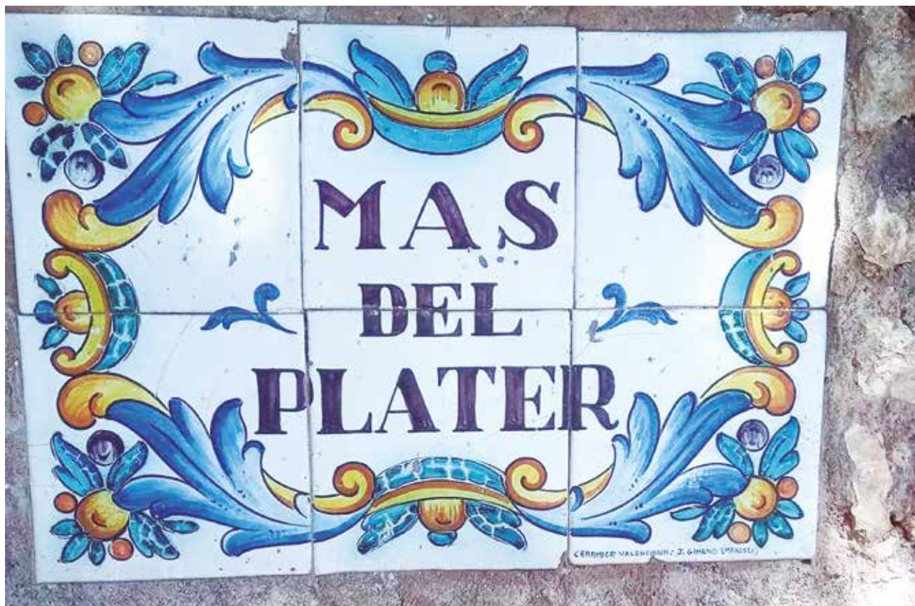
FOTOGRAFIA DEL AUTOR