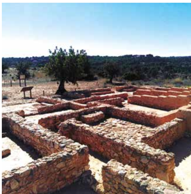
Foto 1, El Tòs Pelat

De forma resumida podem dir que el lloc més antic que va estar habitat pels éssers humans dins del terme municipal de Montcada és el gran oppidum ibèric o "ciutat" ibèrica que coneixem com el Tòs Pelat (de propietat privada) que remunta els seus orígens al s. VI aC.