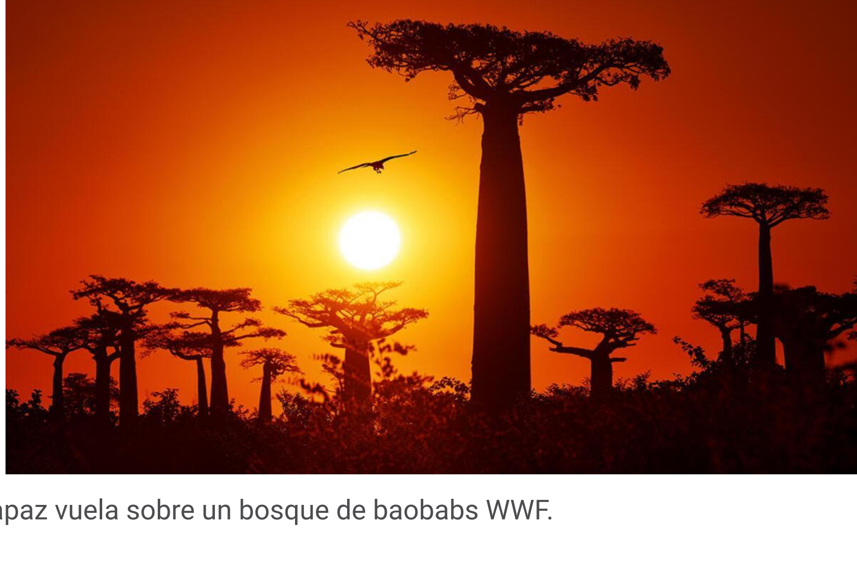
Una rapaz vuela sobre un bosque de baobabs WWF.