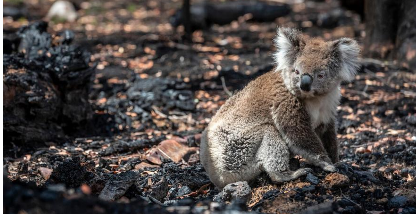
Un koala en el suelo tras un incendio forestal.

La biodiversidad es la “variedad existente entre los organismos vivos”, según define la ONU. “Es esencial para la función de los ecosistemas y que estos presten sus servicios ”, añade la Organización de la ONU para la alimentación y la agricultura (FAO).