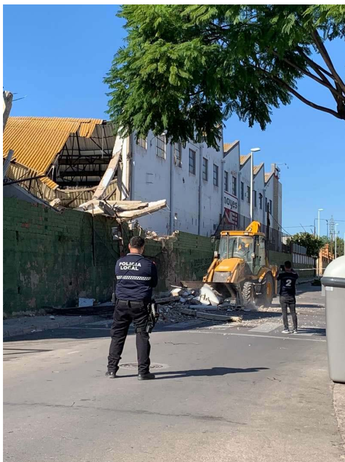
Un policía local supervisa el derrumbe. EPDA

Parte de la histórica fábrica de Nayas en el barrio de los Dolores de Moncada se ha venido abajo en la mañana de este domingo. Llevaba varios días acordonada la zona por peligro de derrumbamiento, como han denunciado a El Periódico de Aquí fuentes de la Asociación de Vecinos de dicho barrio de la localidad de l'Horta Nord, quienes muestran su preocupación "por el amianto en el aire". Hasta allí se han desplazado agentes de la Policía Local y autoridades municipales.