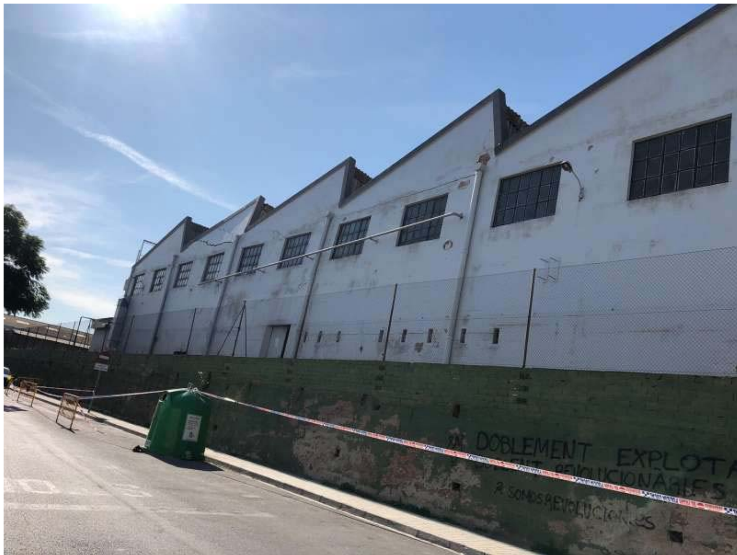
Fachada de Nayas. EPDA

Las imágenes las han compartido miembros de la Asociación de Vecinos.